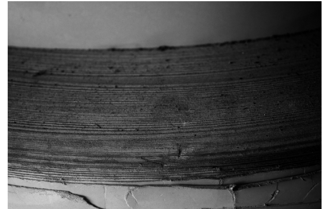
Fig.5 Serie Database. Impresión digital, 61x90cm. 2011-2012