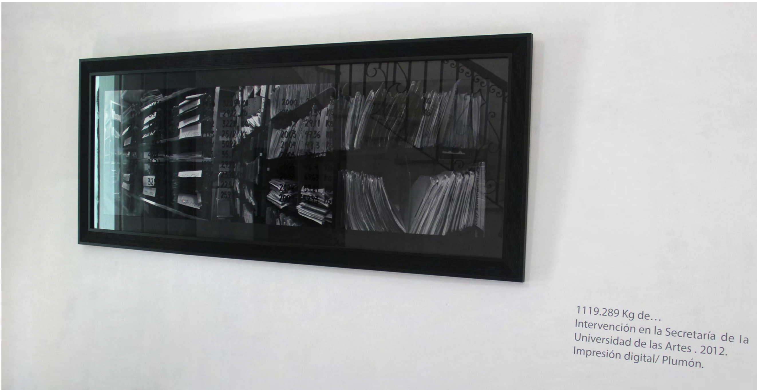
Fig.13 Vista parcial de la exposición.