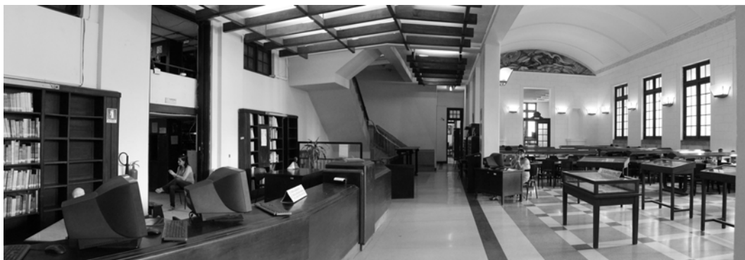
Fig.8 Biblioteca de la Universidad de la Habana.

veintitrés años y la profundidad casi siempre ascendente de sus propuestas artísticas, confío en su intuición creadora.