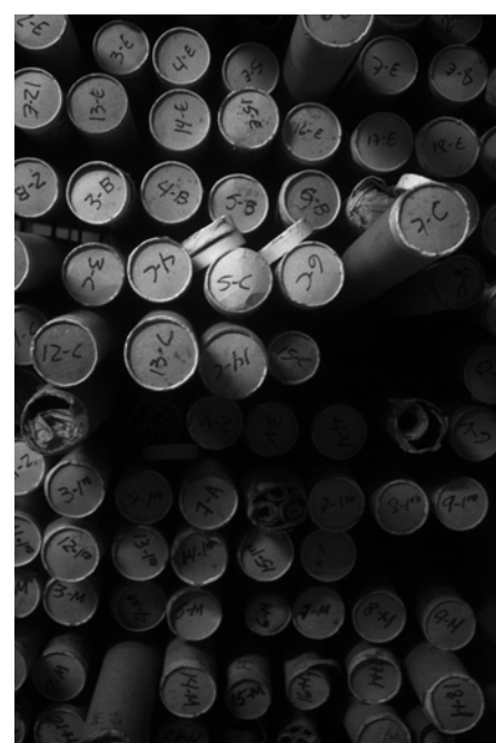
Serie Database. Impresión digital, 61x90cm. 2011-2012