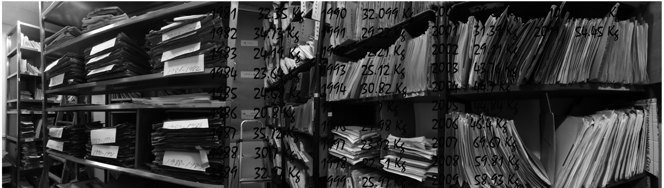
Fig.6 1119.289 Kg de... Impresión digital/ Plumón permanente. 61x200cm. 2012

bajo esta modificación estilística; incluso, en su sentido de epígono 699,6 Kg (Peso bruto) puede estar sobrando en esta muestra. Su pertinencia radica, precisamente, en el sentido de intrusión al propio espacio expositivo, con lo que la pieza articula de modo coherente con Stock, la otra obra antes mencionada. Si 1119.289 Kg de... y 699,6 Kg (Peso bruto) discursan sobre la transmutación del valor del archivo, Stock introduce otra arista del asunto: la de la disfuncionalidad. En medio de la sala expositiva, sobre