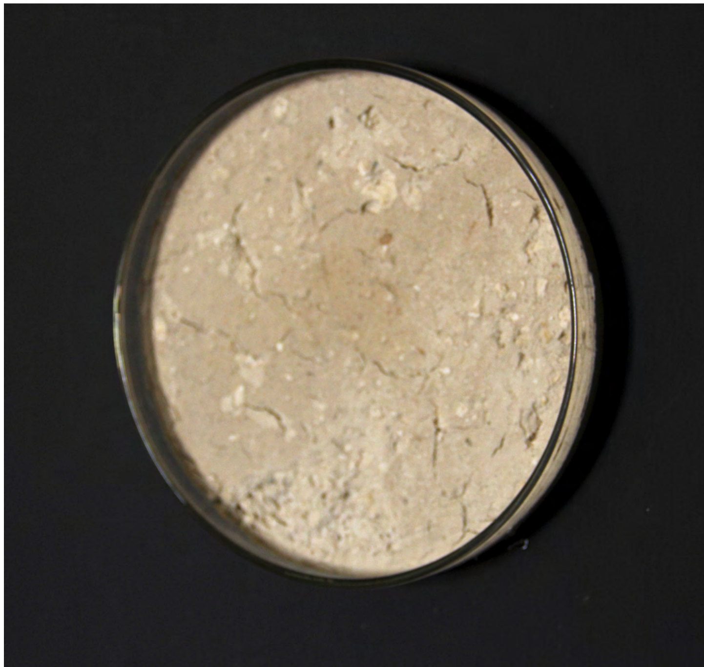
Fig.9 Purgante. Intervención en la biblioteca de la Universidad de la Habana. Magnesia. 2013

1. Consistente en el procedimiento de extracción de agua mediante deshumificadores de la Biblioteca de la Universidad de La Habana; el agua fue hervida hasta extraerle la magnesia. La pieza presentó en exposición un recipiente de laboratorio que contenía esta magnesia junto a un video que registraba la acción procesual y una breve explicación en texto de vinilo sobre pared.