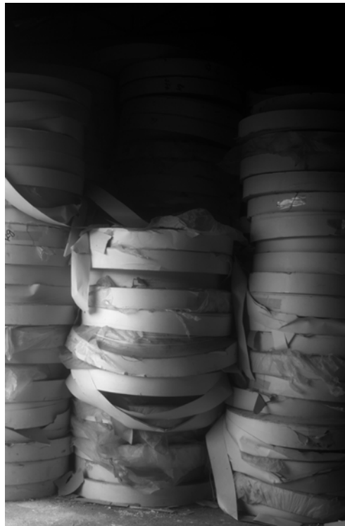
Fig.10 Serie Database. Impresión digital, 61x90cm. 2011-2012