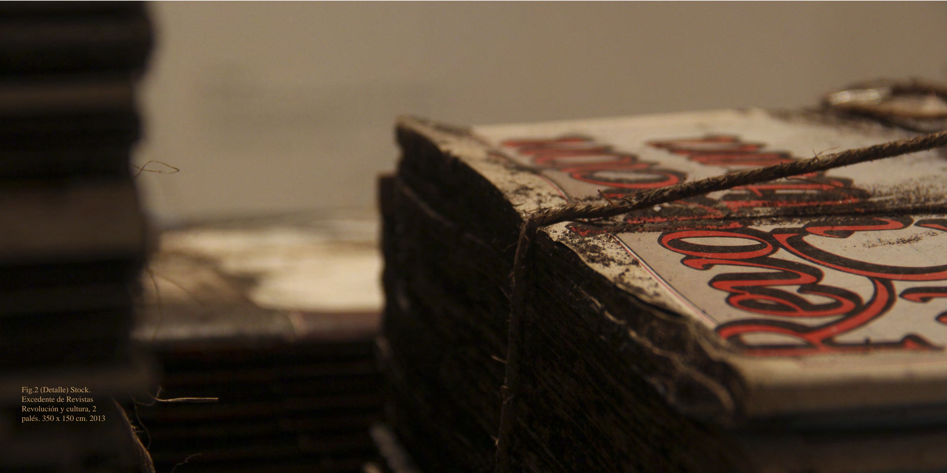
Fig.2 (Detalle) Stock. Excedente de Revistas Revolución y cultura, 2 palés. 350 x 150 cm. 2013