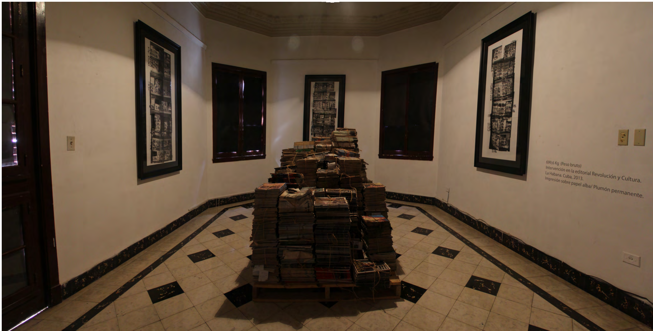
Fig.4 Stock. Excedente de Revistas Revolución y cultura, 2 palés. 350 x 150 cm. 2013