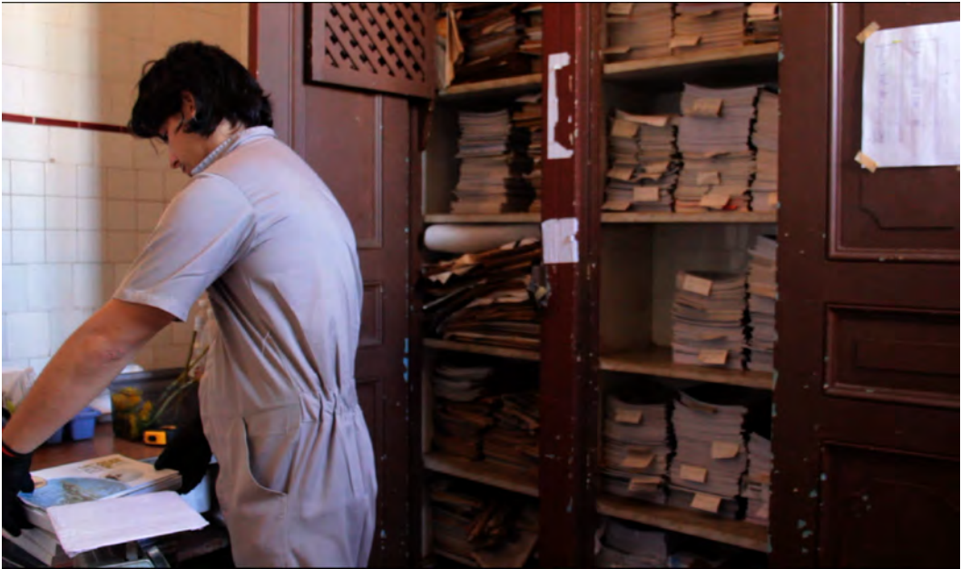
Fig.1 Acción 1: Proceso de Pesaje de los archivos de la revista Revolución y Cultu-

Fotografía y diseño Rigoberto Díaz Martínez